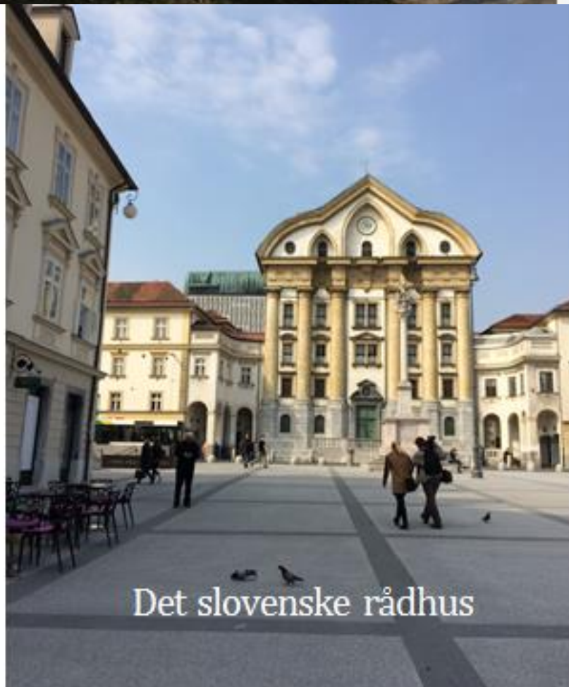
Det slovenske rådhus